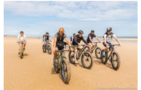
Fatbike sur Omaha Beach avec Eolia Normandie