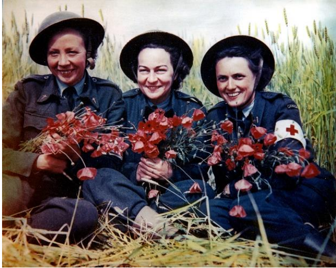
Exposition Femmes dans la Guerre : 1939 – 1945

du 1er mars à fin décembre 2019 au Centre Juno Beach, Courseulles-sur-mer