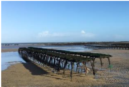
Balade gourmande à vélo