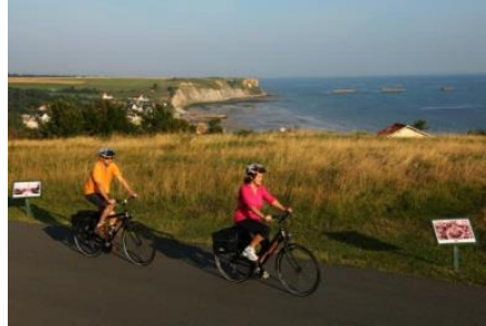
Véloroute Plages du Débarquement – Mont-Saint-Michel