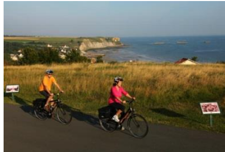
Véloroute Plages du Débarquement – Mont-Saint-Michel